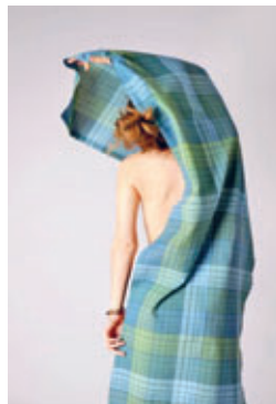
Marie Neubert, Baumwolle

Sie sind jung, sie sind kreativ und sie studieren im Erzgebirge. Sie experimentieren am Webstuhl, klöppeln mit Silberdraht, entwerfen Ornamente auf Papier, forschen an Materialien oder gestalten Stoffe. Ihr Arbeitsmittelpunkt ist zurzeit die Fakultät für Angewandte Kunst Schneeberg. Im Schloss Lauenstein, am anderen Ende des Erzgebirges also, zeigen Studentinnen und Studenten der