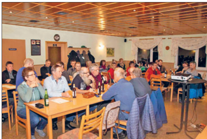
42 stimmberechtigte TSV-Mitglieder folgten der Einladung.

Altenbergs Bürgermeister Markus Wiesenberg ging auf die Frage nach der Energieproblematik und der weiteren Nutzung der Turnhalle Geising und des Philipp-Müller-Lagers ein. Er betonte, dass am